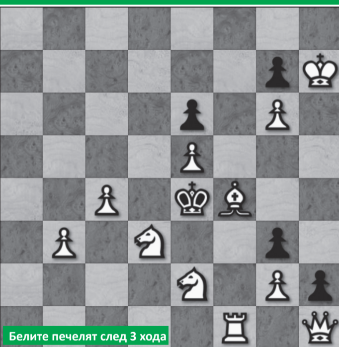
Белите печелят след 3 хода