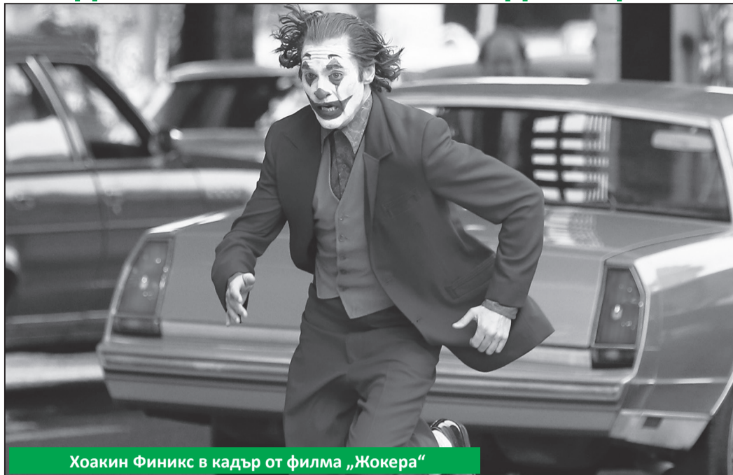
Хоакин Финикс в кадър от филма „Жокера“

Първата среща на „Жокера“ с публиката преди месец беше повече от победоносна. Осемминутните овации на крака от придирчивата фестивална публика след премиерната прожекция във Венеция, виковете „Браво“ от пресконференцията, първите възторжени отзиви и, разбира се, спечелването на „Златния лъв“ (за първи път от филм с комиксов герой) предизвикаха нездрав ентузиазъм и прекомерни очаквания за някакво едва ли не историческо киноявление. Това се изрази в безумния първоначален зрителски рейтинг от 9,7 от 10 точки в IMDb от 4000 души. В момента е 9,0 от 10 от 160 хиляди зрители (за сравнение „Кръстникът“ е оценен с 9,2, при това от 1.5 млн. зрители). После дойдоха тревогите.