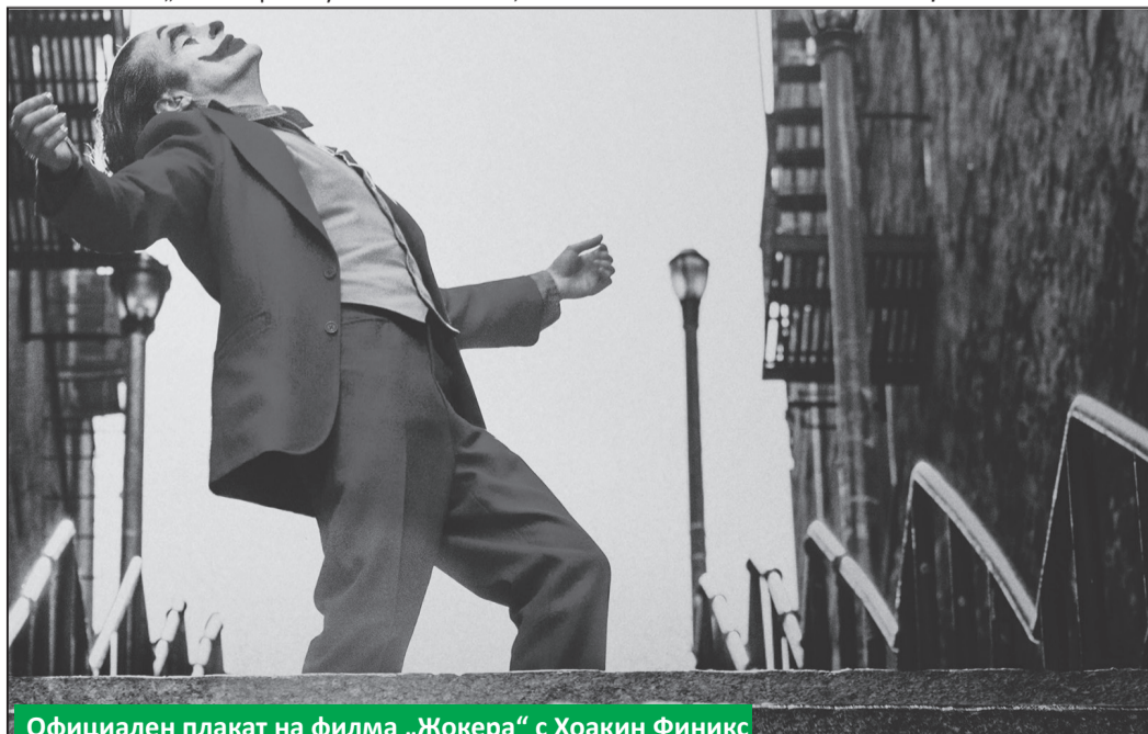
Официален плакат на филма „Жокера“ с Хоакин Финикс

Всеки, който пожелае, може да гледа филма в „Кино - Троян“ или „Кино Космос - Ловеч“ тази седмица.